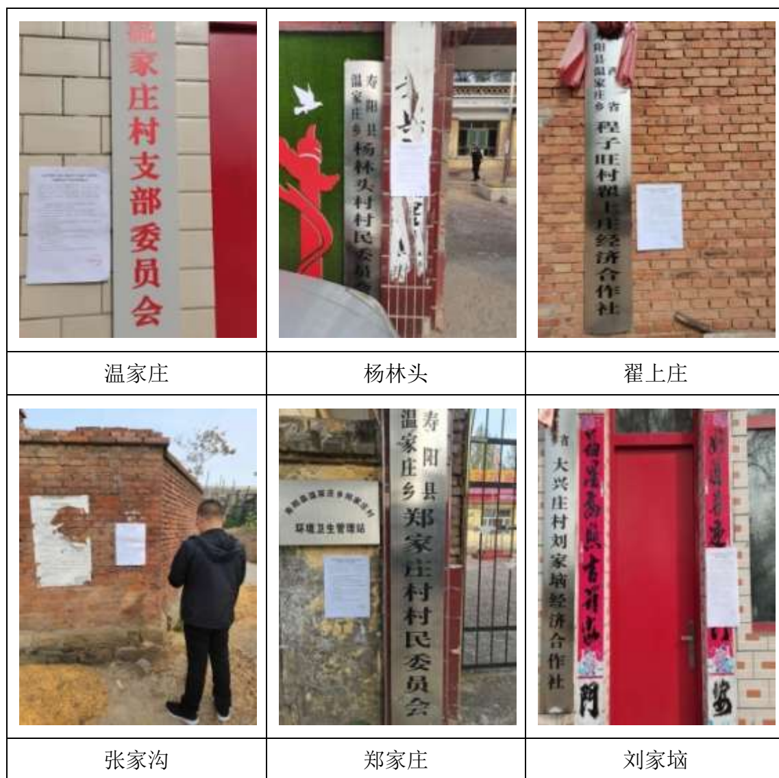
图 4 周边村庄张贴公示照片