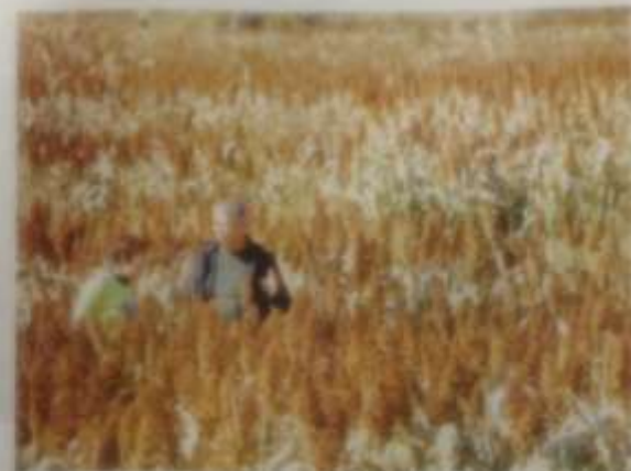
市民在农博会现场选购农产品。

农博会主办方表示，此次农博会不仅是一个展示农产品、促进消费的平台，更是一个宣传消费扶贫、助力脱贫攻坚的平台。通过举办农博会，可以让更多市民了解贫困地区的情况，支持消费扶贫，为脱贫攻坚贡献力量。