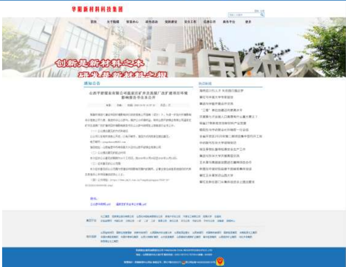
图 5 第三次网络公示截图