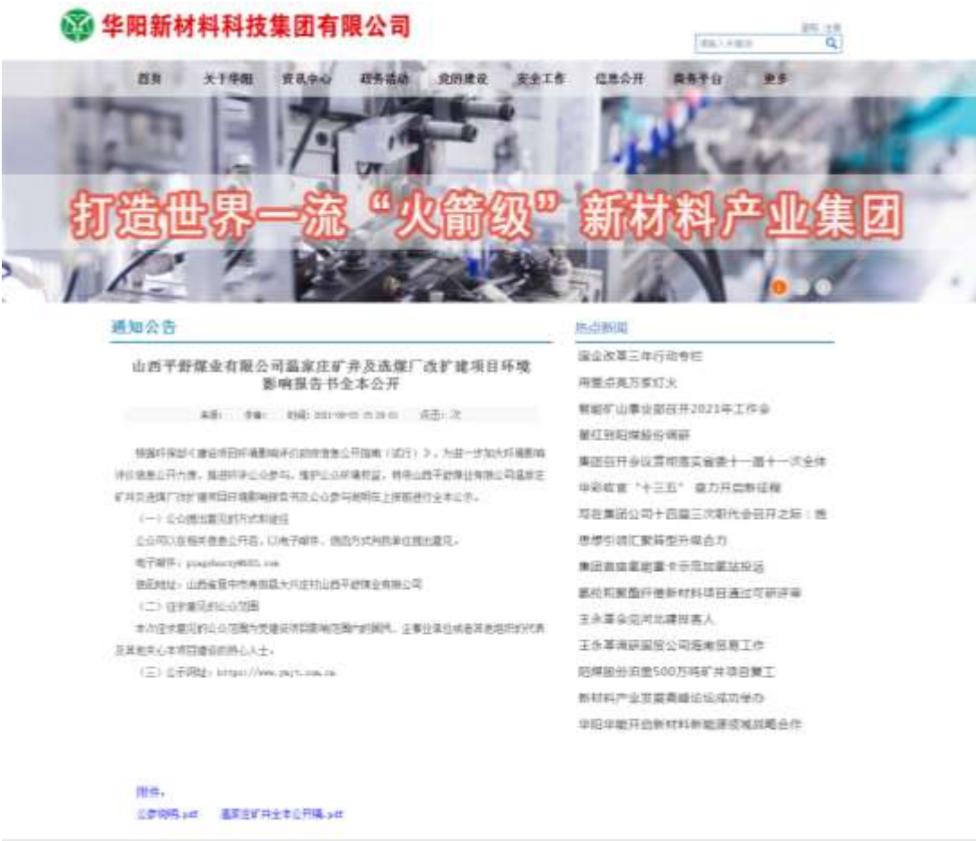
图 6 会后修改版网络公示截图