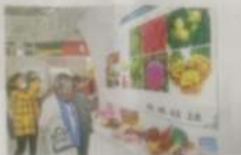
市民在农博会现场选购农产品。

农博会主办方表示，此次农博会不仅是一个展示农产品、促进消费的平台，更是一个宣传消费扶贫、助力脱贫攻坚的平台。通过举办农博会，可以让更多市民了解贫困地区的情况，支持消费扶贫，为脱贫攻坚贡献力量。