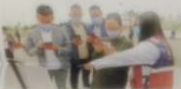
市民在农博会现场选购农产品。

农博会主办方表示，此次农博会不仅是一个展示农产品、促进消费的平台，更是一个宣传消费扶贫、助力脱贫攻坚的平台。通过举办农博会，可以让更多市民了解贫困地区的情况，支持消费扶贫，为脱贫攻坚贡献力量。